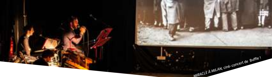
MIRACLE À MILAN, ciné-concert de Buffle !