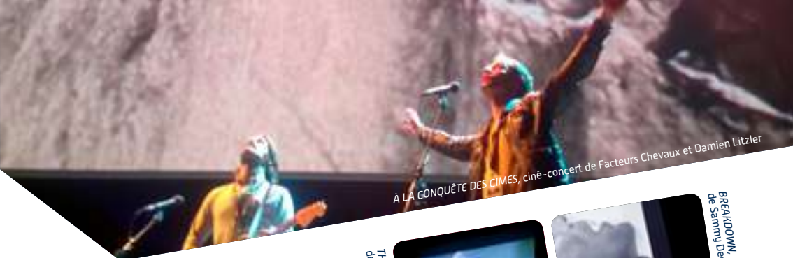
À LA CONQUÊTE DES CIMES, ciné-concert de Facteurs Chevaux et Damien Litzler